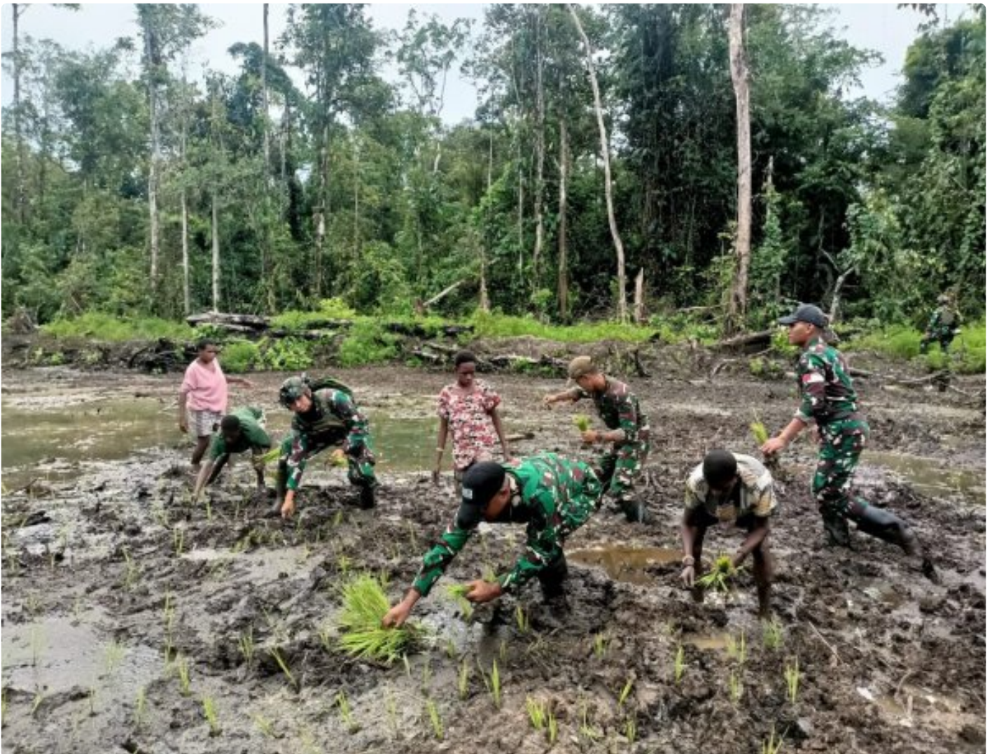
Foto: Satgas Pamtas Mobile RI-PNG Yonif 503/Mayangkara menggagas program ketahanan pangan yang melibatkan langsung warga Kampung Mumugu, Distrik Krepkuri, Kabupaten Nduga, Selasa (07/01/2025).

NDUGA- Dalam upaya membangun kesejahteraan masyarakat di wilayah penugasan Papua Pegunungan, Satgas Pamtas Mobile RI-PNG Yonif 503/Mayangkara