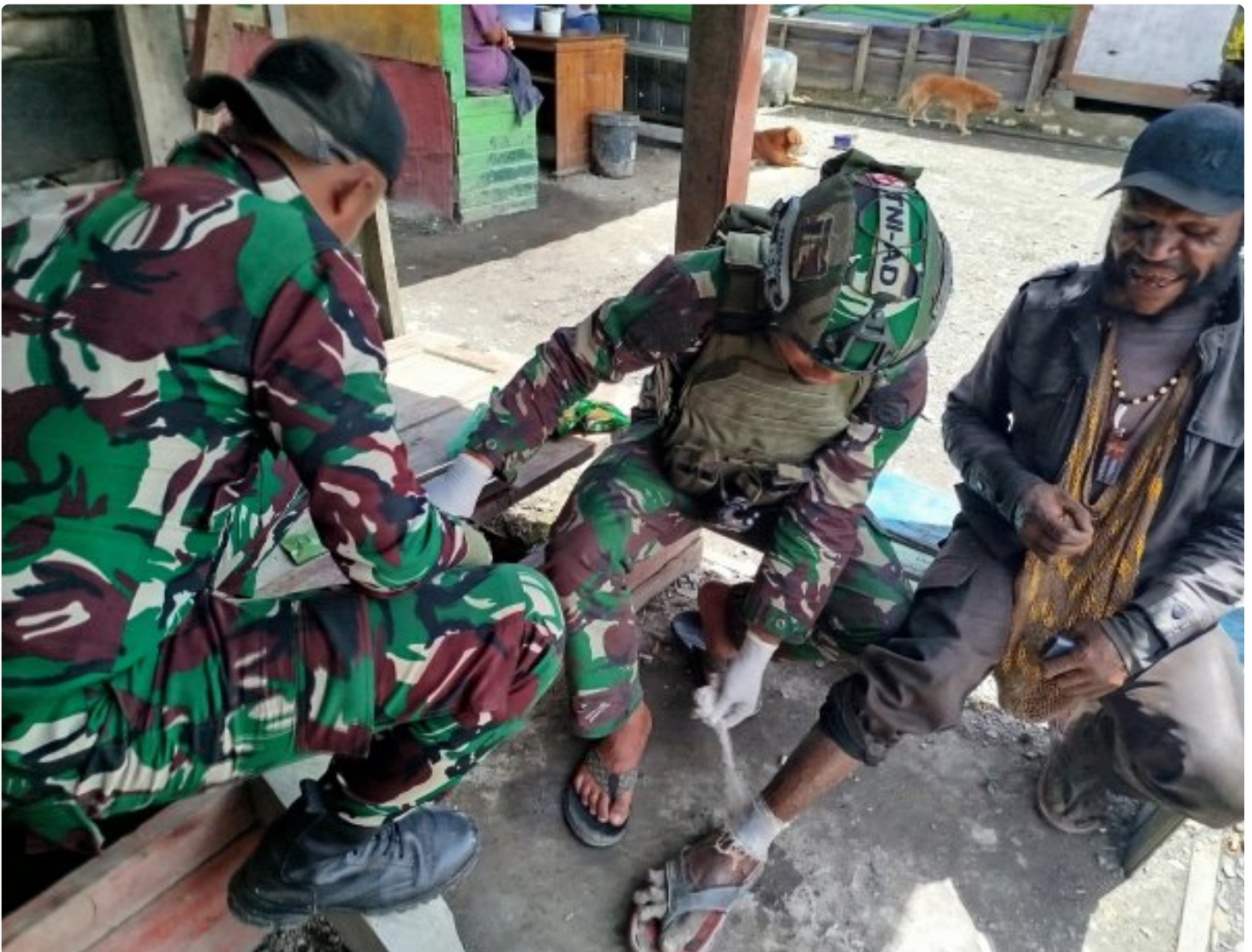
tim kesehatan Satgas membantu seorang warga yang mengalami luka bakar. Minggu (08/12/2024).

PAPUA- Dalam misi mulia, Satgas Yonif 509 Kostrad kembali membuktikan dedikasinya kepada masyarakat. Di Titik Kuat J2, tim kesehatan Satgas membantu seorang warga yang mengalami luka bakar. Langkah sigap ini